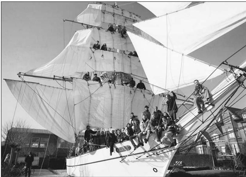
Kaatje in vol ornaat