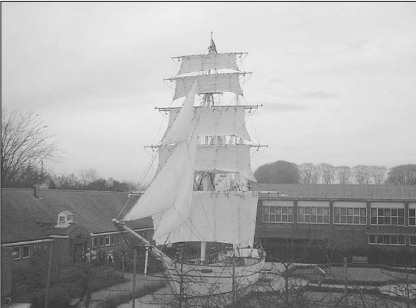
Schoolgebouw met oefenscheepje Kaatje.