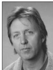
Age Bandstra Staveren Laden en Stuwen