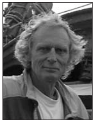
Auk Boom Wormerveer Scheepswerktuig- kunde